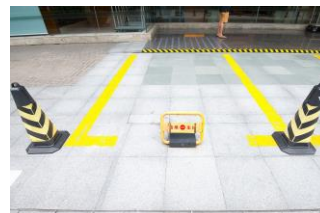
Gestão de estacionamento privado