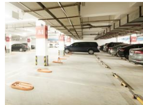
Gestão de estacionamento público