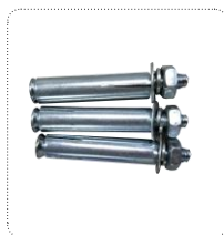
Parafuso de expansão